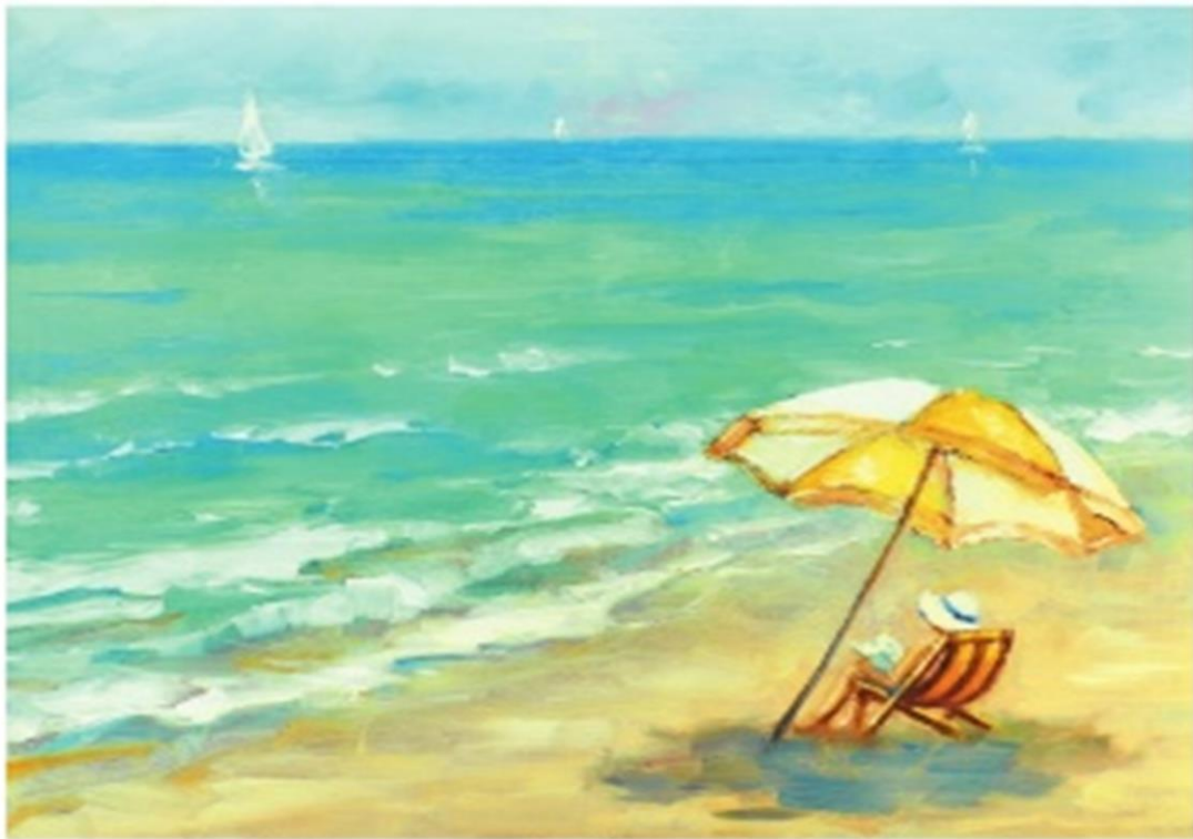
Oleg Sumarokov Kobieta pod parasolem odpoczywająca na plaży