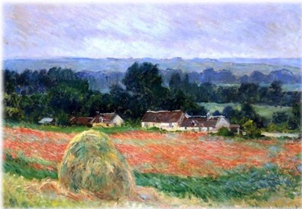
Claude`a Moneta - Stogi siana w Giverny