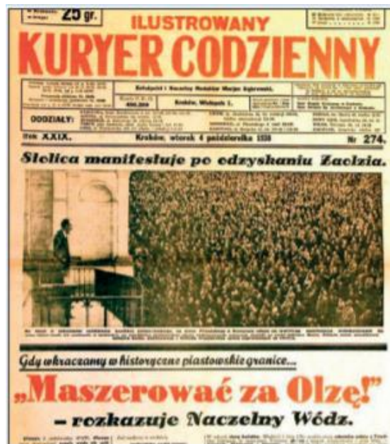
1. Strona tytułowa Ilustrowanego Kuriera Codziennego z 4 X 1938 r. z relacjami o zajęciu Zaolzia przez wojska polskie