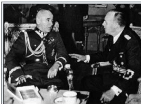
2. Marszałek Edward Rydz-Śmigły w rozmowie z ministrem spraw zagranicznych III Rzeszy Joachimem von Ribbentropem w Warszawie w 1938 r.