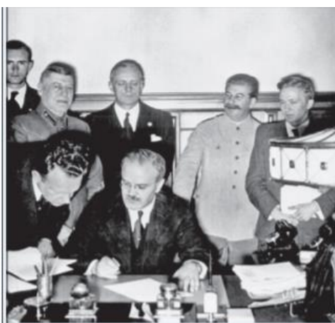
3. Wiaczesław Mołotow podpisujący, w obecności Stalina i Ribbentropa, niemiecko-radziecki pakt o nieagresji zw. paktem Ribbentrop-Mołotow, 23 VIII 1939 r.