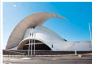
▲ Audytorium „Adán Martín” na przylądku Santa Cruz, Hiszpania, 2003