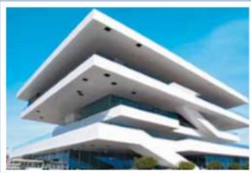
▲ Port w Walencji, Hiszpania, 2007