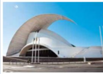
▲ Audytorium „Adán Martín” na przystądku Santa Cruz, Hiszpania, 2003