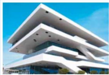
▲ Port w Walencji, Hiszpania, 2007