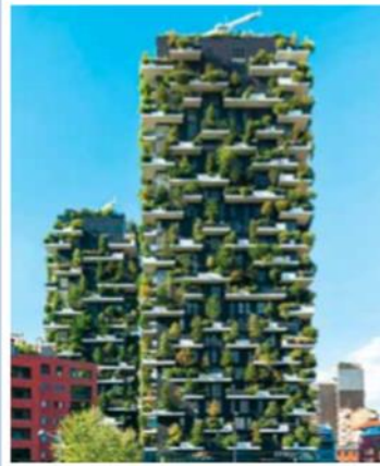
▲ Bosco Verticale [czyt. bosko wertikale, wł. pionowy las], Mediolan, Włochy, 2014