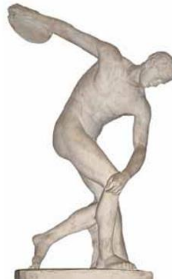
▲ Myron Dyskopol , V w. p.n.e. Zasada złotego podziału w kompozycji dzieła z czasów starożytnych