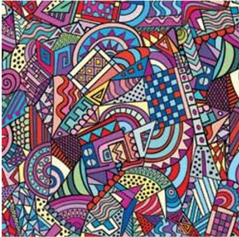
▲ Kompozycja dynamiczna

Kompozycja może być płaska (np. rysunek, obraz malarski) lub przestrzenna (np. relief, bryła rzeźbiarska, budowla).