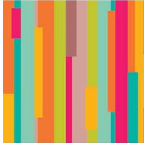
▲ Kompozycja statyczna